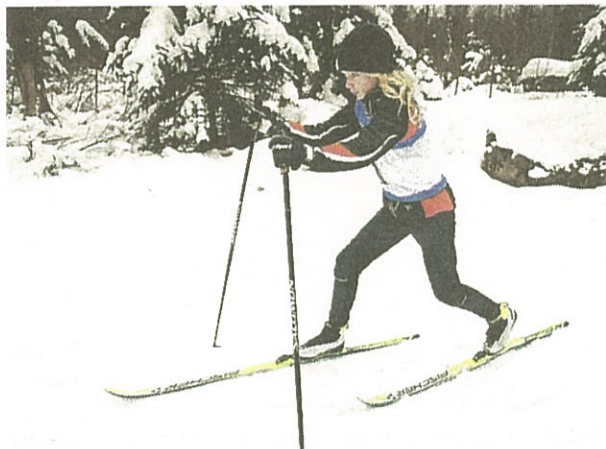
Här vid Dackestugan har Karlskrona SOK fått miljonbidrag till en ny anläggning.

– Vi hoppas att den nya anläggningen ska vara på plats i januari 2017 om alla