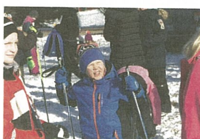
Solen är härlig.