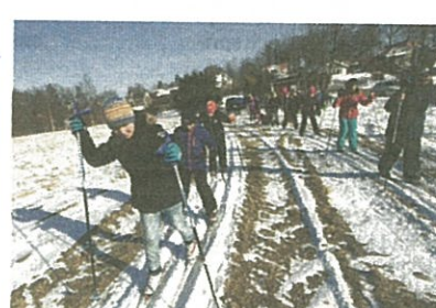
Starten för elevernas Skolklassiker har gått. De ska åka 90 kilometer tillsammans