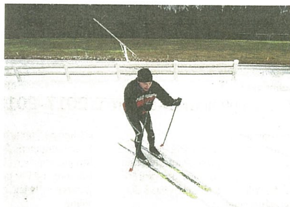
Under söndagen hade cirka 400 meter snö lagts ut i spåret i Karlsnäs.